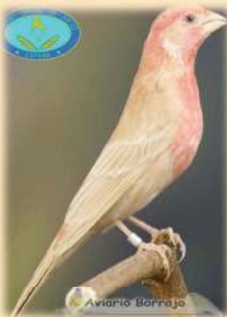
Diseño poco contrastado