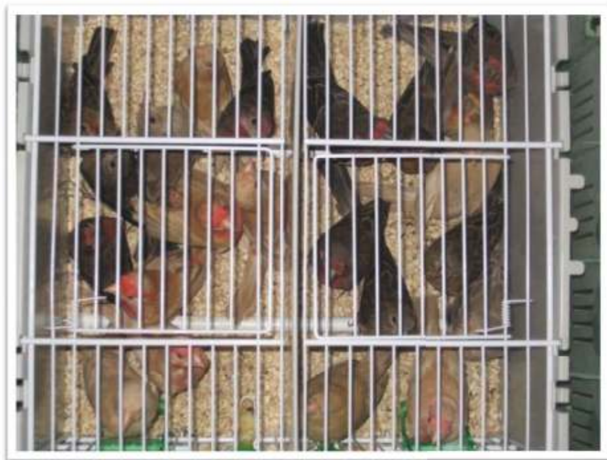
Distintas tonalidades posibles en la misma mutación

Hay que tener mucho cuidado a la hora de enjuiciar estos ejemplares y distinguir los puros de los intermedios con la mutación Phaeo Diseño Ocelado. (como se explicó anteriormente).