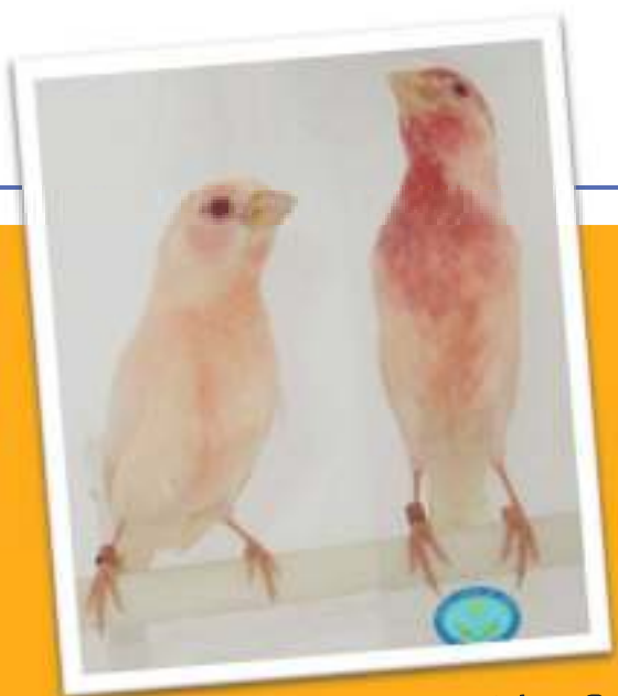
Bonita pareja de albinos