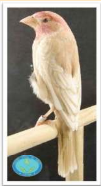
Postura horrible, pico largo, cola corta...