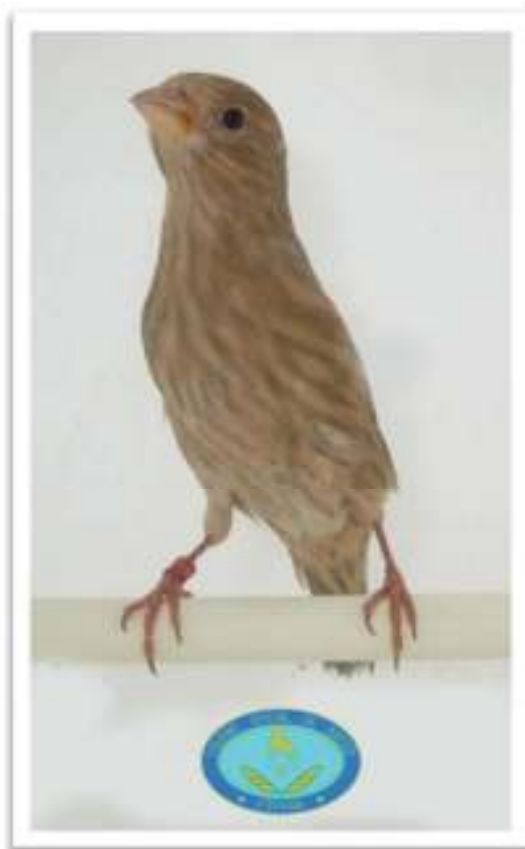
Excelente diseño frontal

Hay que tener en cuenta que no se le puede exigir al camachuelo mejicano la misma