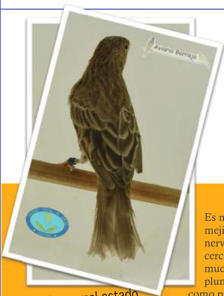
Plumaje en mal estado