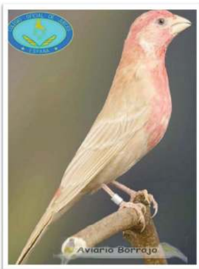
Forma, postura y talla óptima

En algún momento del enjuiciamiento puede presentar la postura de cortejo o parada nupcial en ambos sexos, que se caracteriza por presentar el cuerpo arqueado, con perfil cóncavo desde arriba y con las alas por debajo de la cola. Pasado el momento y en posición de trabajo debe presentar la postura anteriormente descrita.