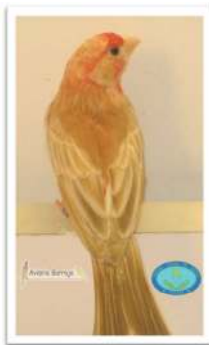
Cabeza plana y poco cuello